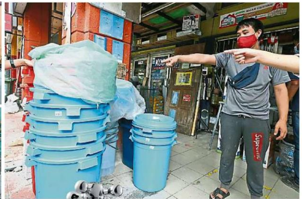
水桶在大制水来临下相当畅销, 尤其是大容量的水桶获得顾客青睐。