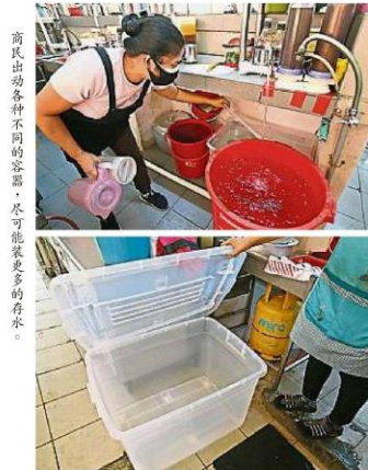
商民出动各种不同的容器, 尽可能装更多的存水。

《大都会》社区报记者到为受影响地区之一的甲洞巡视, 以了解当地商民为制水所做的准备。