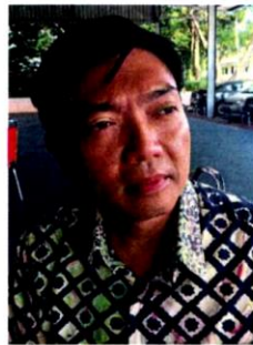
Tan has received feedback from unhappy residents on the unsuitable timing of the RTPJ objections period.

"For the sake of proper governance, transparency and public interest, I am requesting, on behalf of residents, for an extension to the objection period," said Tan.