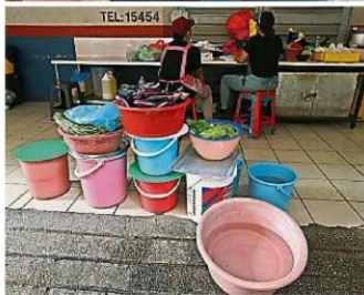
↑ 業者出動大桶裝上存水, 以在制水期間有足夠的水可繼續做生意。