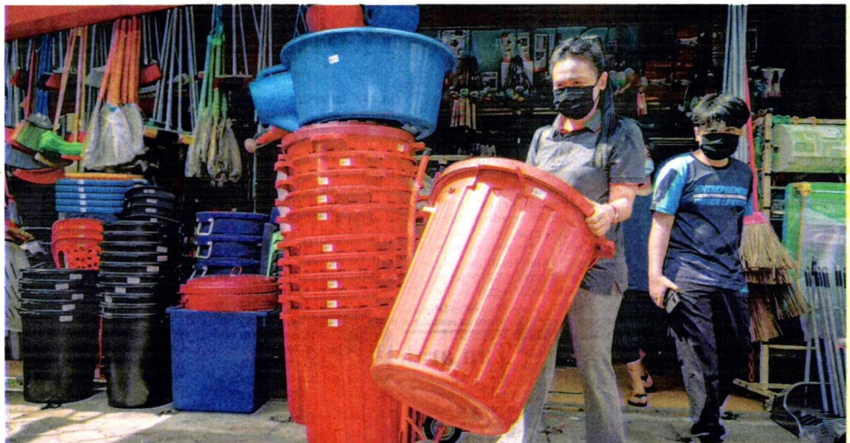
SEORANG penduduk di Jalan Kebun, Shah Alam, Selangor membeli bekas simpanan air di sebuah kedai sebagai persediaan menghadapi gangguan bekalan air bermula hari ini hingga Sabtu ini.

Tong air bersaiz dua liter dijual dengan harga RM22.90 dan deretan tong air turut diletakkan pada bahagian hadapan kedai untuk memudahkan orang ramai membuat perbandingan harga.