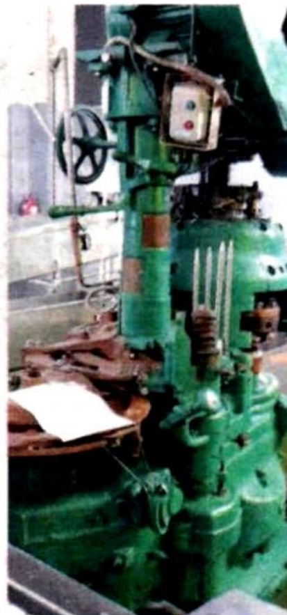
Sebuah peralatan disita di bawah Seksyen 38(1)(a) Akta Kualiti Alam Sekeliling, 1974 bagi tujuan pemeriksaan.

JAS memberitahu, premis itu diarahkan melakukan pembersihan longkang yang tercemar serta-merta.