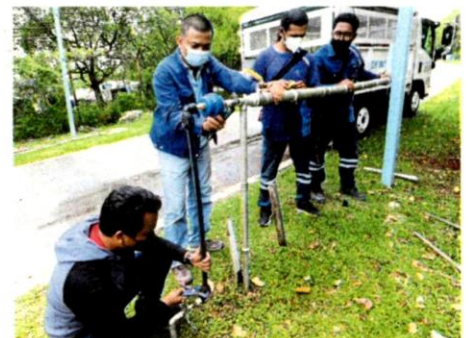
Kakitangan Air Selangor memasang pili air awam di tepi jalan dekat Salak Selatan bagi kemudahan orang ramai mengambil air.

Sementara itu, tinjauan di pili awam berdekatan Sekolah Kebangsaan Shah Alam, Seksyen 16 dan di hadapan Hospital Tengku Ampuan Rahimah (HTAR), Klang mendapati paip sudah dipasang untuk kegunaan penduduk sekitar.