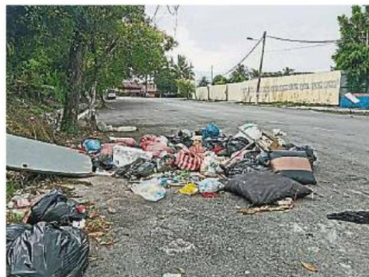
蕉賴再也商业区衔接至住宅区的第3路沦为非法垃圾场。