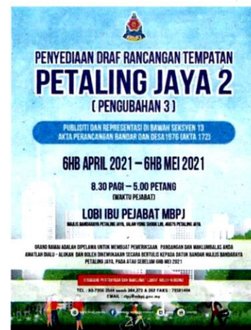
The Petaling Jaya Local Plan 2 third amendment objections took place from April 6 to May 6 this year.